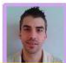
Nathan Dubois Informatique